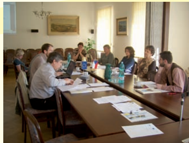
Výdalo SMO Vltava v roce 2007 v rámci projektu „Pokračování komunitního plánování na Vltavotýnsku“

Více informací o komunitním plánování sociálních služeb na Vltavotýnsku najdete na www.tnv.cz