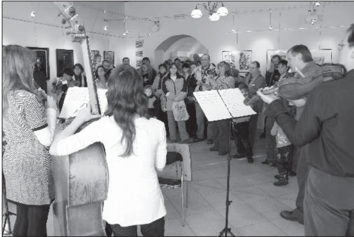
Příjemnou atmosféru vernisáže Vánoční výstavy dokreslila hudbou Vltavotýnská kapela Základní umělecké školy v Týně.

První prosincovou sobotu byla vernisáž zahájena dvanáctá letošní výstava v Městské galerii U Zlatého slunce v Týně. Všechny výstavy byly součástí kulturní části 5. Vltavotýnského Oranžového roku jehož partnerem je elektrárna Temelín. Vánoční výstava obrazů, grafiky a keramiky obsahuje díla 22 autorů a potrvá do 2. ledna 2011.