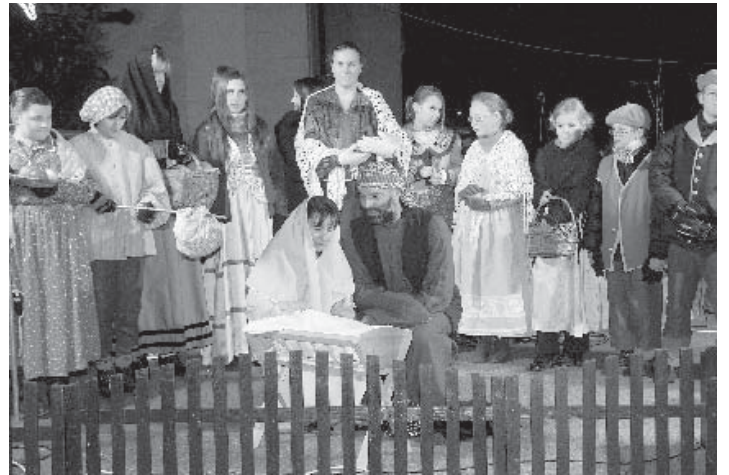
Fotografie B. Langaiera z rozsvěcení vánočního stromu na Týnském náměstí v neděli 28. listopadu.

Redakce Vltavínu děkuje všem čtenářům, inzerentům i dopisovatelům za přičeň a dobrou spolupráci v uplynulém roce. Naší snahou je aby Vltavín obsahoval informace ze všech oblastí - místní politika, kulturní a sportovní informace, historie, zprávy ze škol i sportu. Veřme, že si každý najde ve Vltavínu to svoje, co ho zajímá.